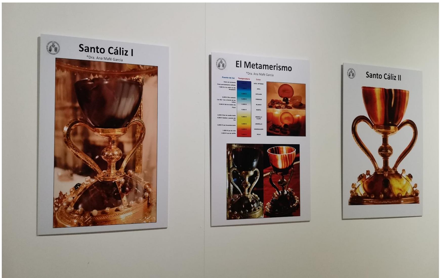
Paneles que ilustran el relato expositivo del Santo Cáliz de la Catedral de Valencia (Onteniente, noviembre 2020).